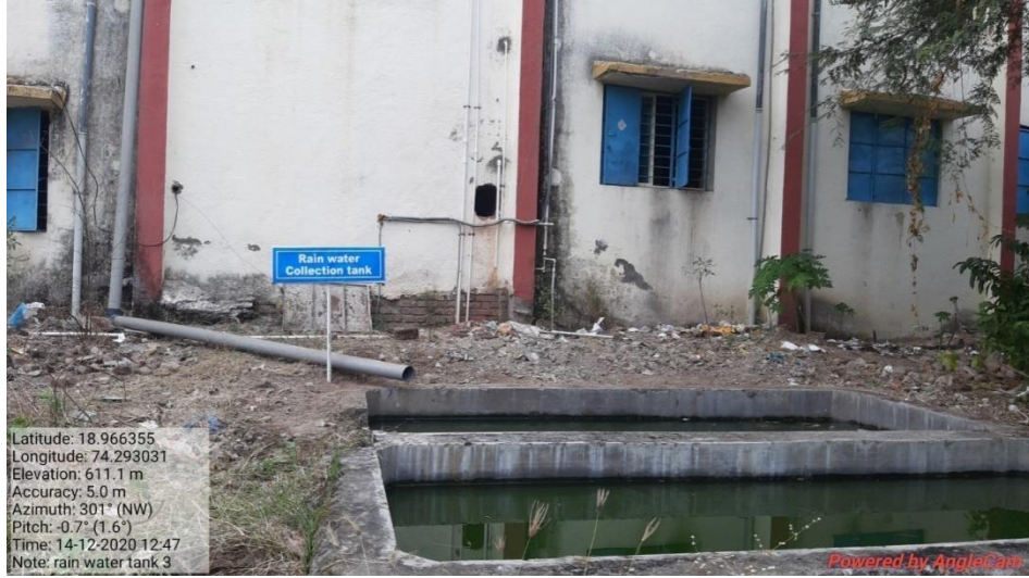
Photograph of Pipe channel system for Rain Water harvesting with tank