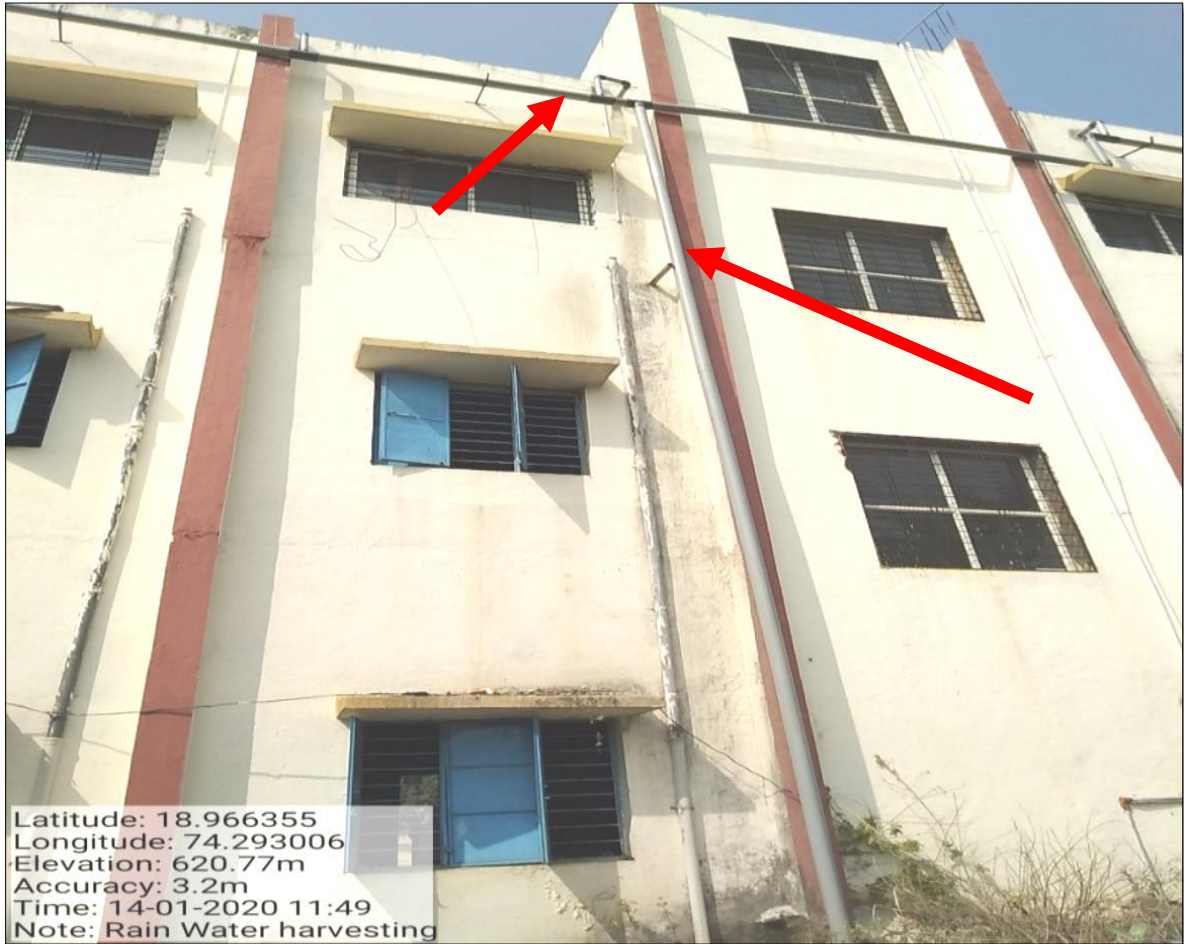
Photograph of Pipe Channel System for Rain Water Harvesting