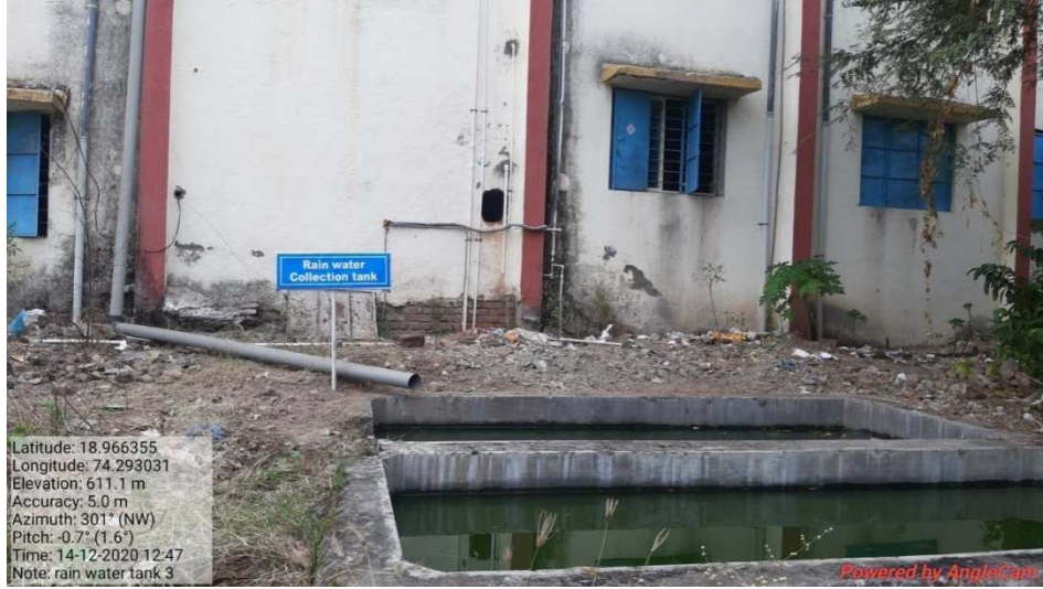
Photograph of Pipe channel system for Rain Water harvesting with tank