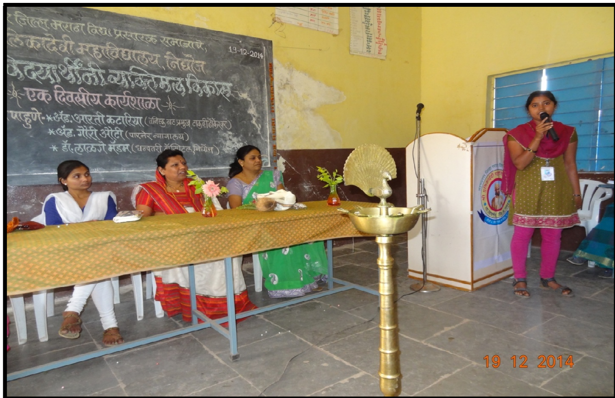
Girl students share their problems