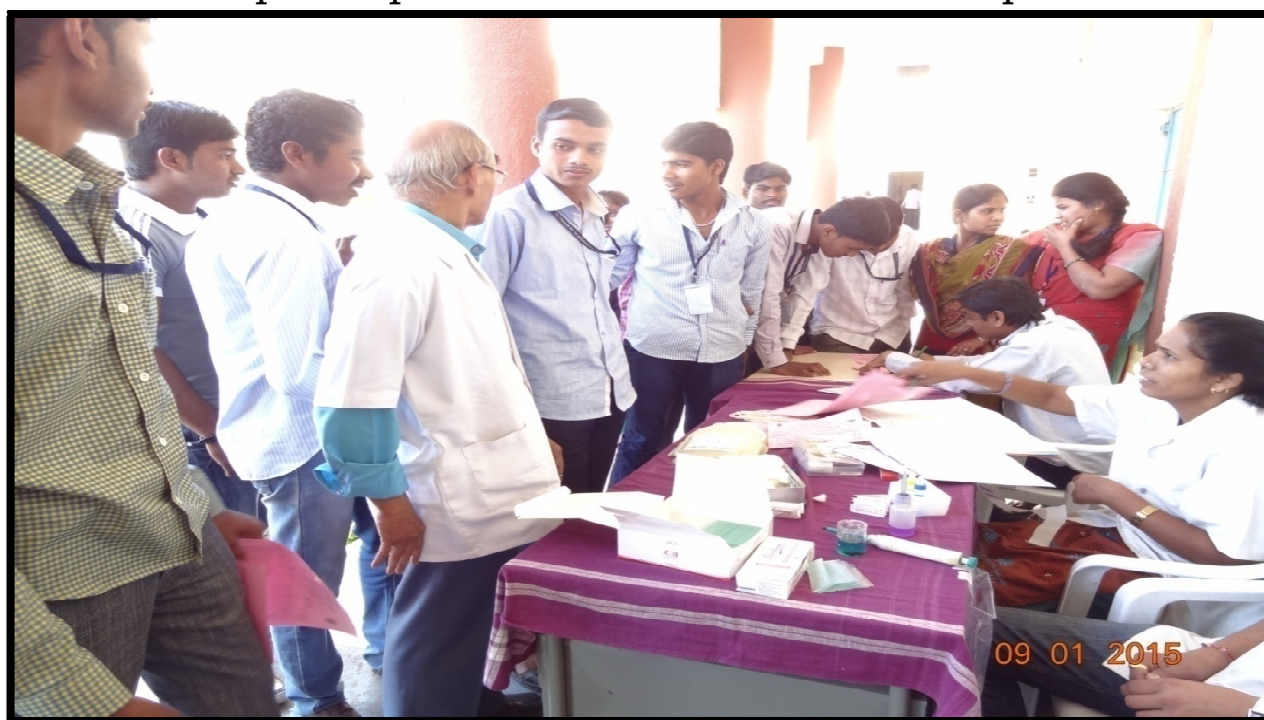
Blood Donation Registration