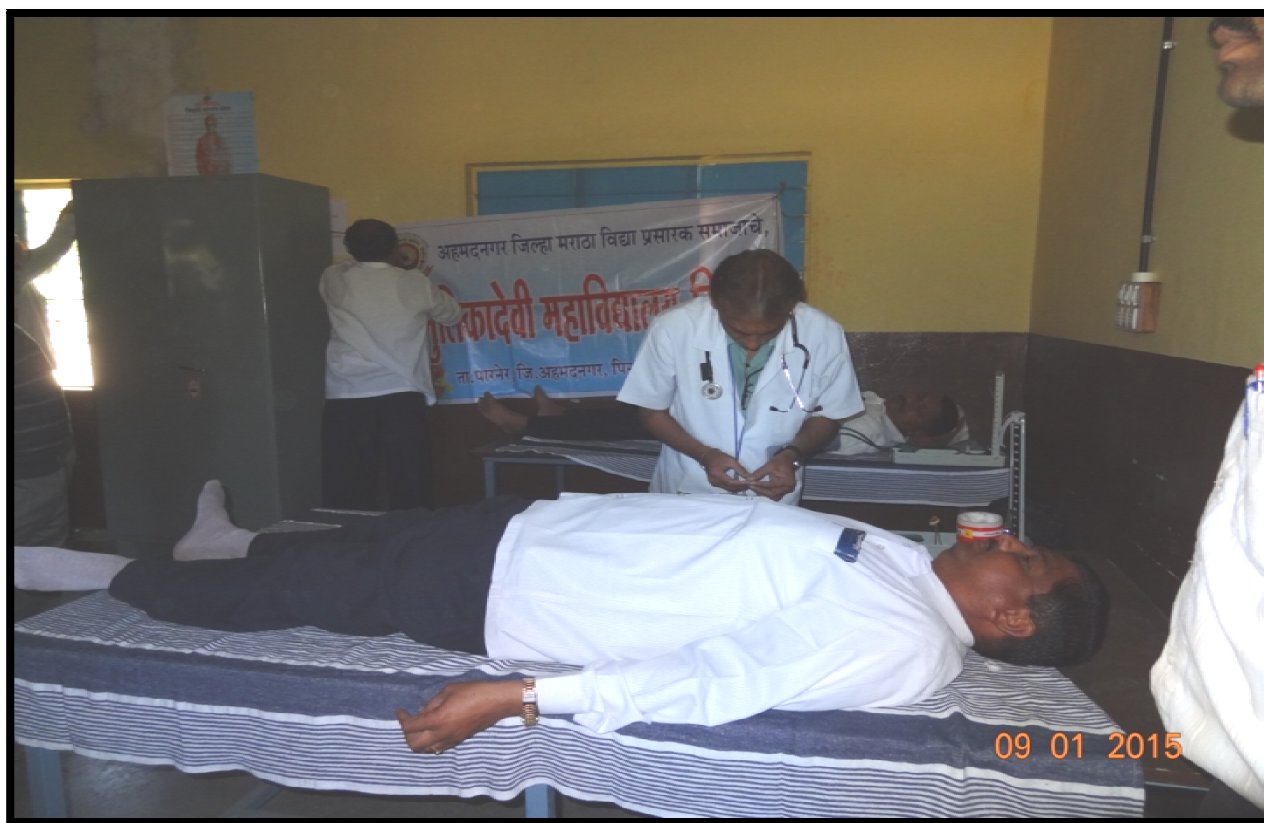
Teacher's participation in blood donation camp