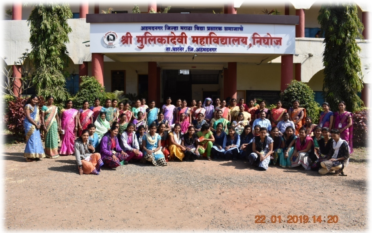
'Aai Mazya Mahavidyalayat' Programme, group photo of mothers and girl students.