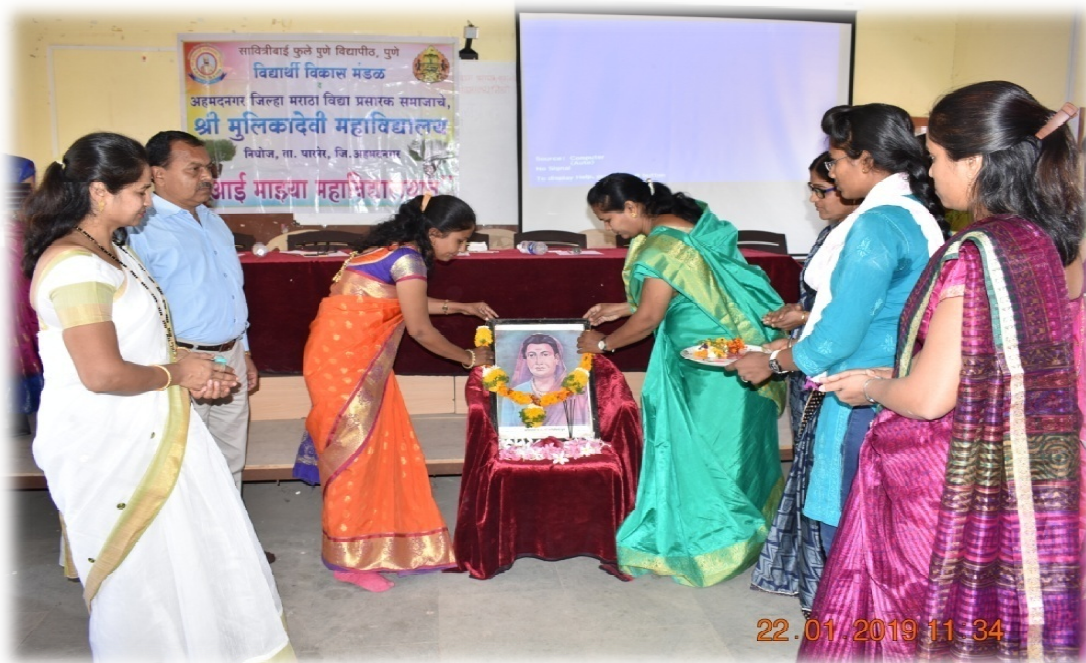
Aai Mazya Mahavidyalayat Programme inauguration function. The chief guest inaugurated Programme.